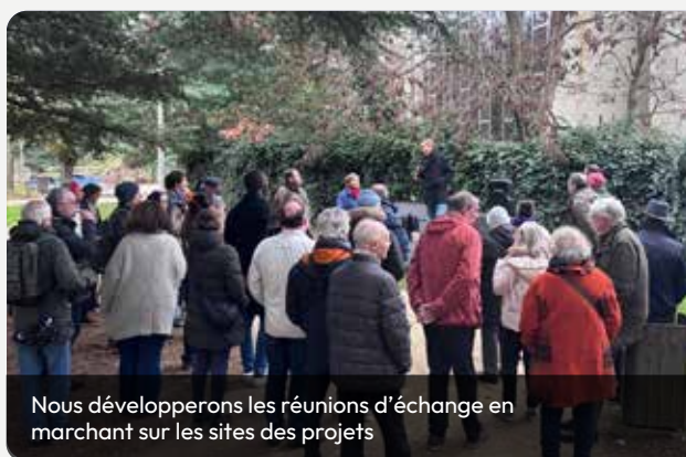
Nous développerons les réunions d'échange en marchant sur les sites des projets