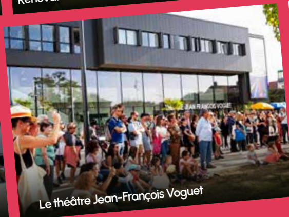
Le théâtre Jean-François Voguet