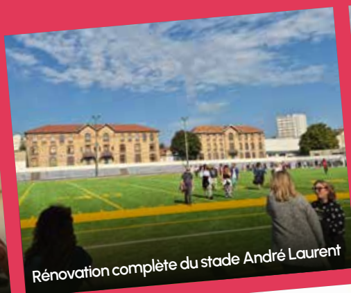
Rénovation complète du stade André Laurent