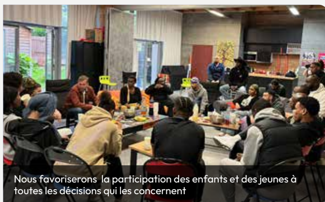
Nous favoriserons la participation des enfants et des jeunes à toutes les décisions qui les concernent