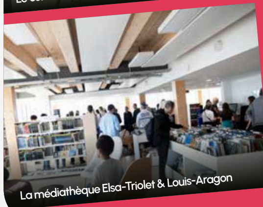
La médiathèque Elsa-Triolet & Louis-Aragon