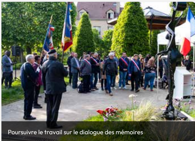
Poursuivre le travail sur le dialogue des mémoires