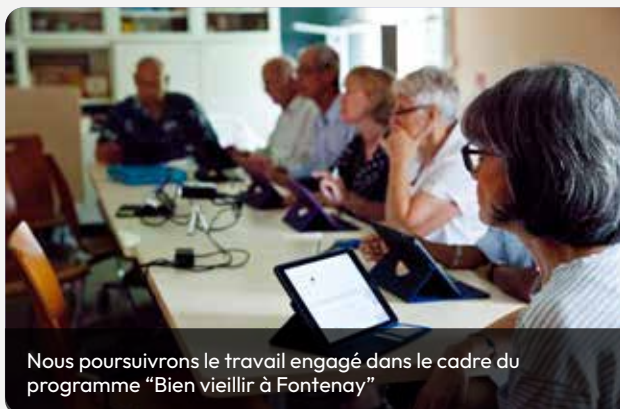
Nous poursuivrons le travail engagé dans le cadre du programme "Bien vieillir à Fontenay"