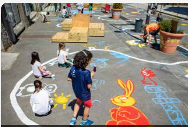
Nous continuerons de pacifier les espaces publics aux abords des écoles pour renforcer la sécurité et la convivialité