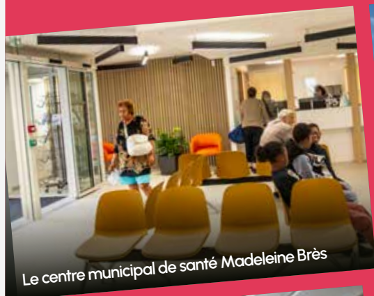
Le centre municipal de santé Madeleine Brès

Retrouvez notre bilan en flashant le QR code