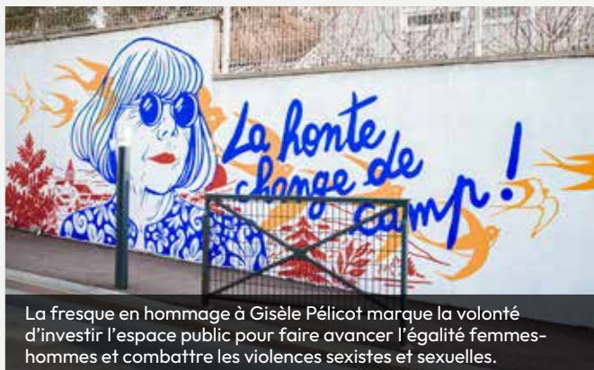
La fresque en hommage à Gisèle Pélicot marque la volonté d'investir l'espace public pour faire avancer l'égalité femmes-hommes et combattre les violences sexistes et sexuelles.