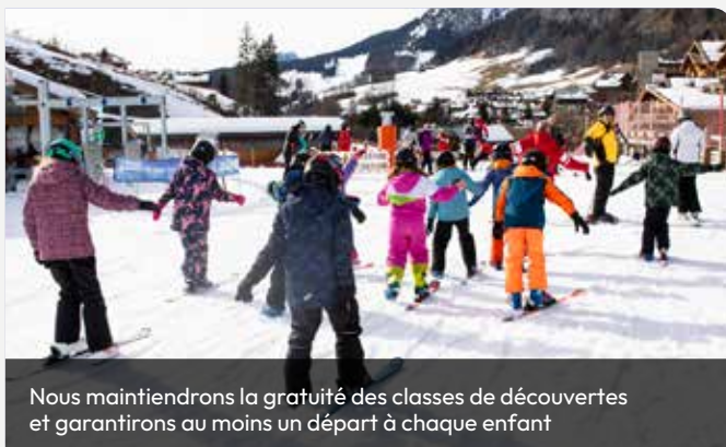
Nous maintiendrons la gratuité des classes de découvertes et garantirons au moins un départ à chaque enfant