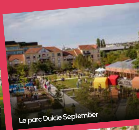
Le parc Dulcie September