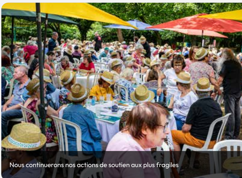
Nous continuerons nos actions de soutien aux plus fragiles