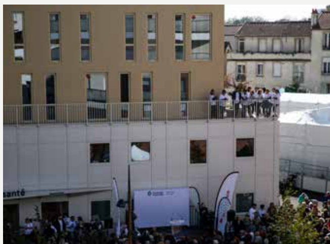
Le nouveau Centre municipal de santé permet à toutes et tous d'accéder à la santé à des tarifs conventionnés