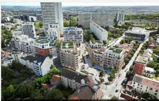
Nous allons créer une place commerçante au pied du quartier Rabelais, en lien avec le nouveau CMS médiathèque