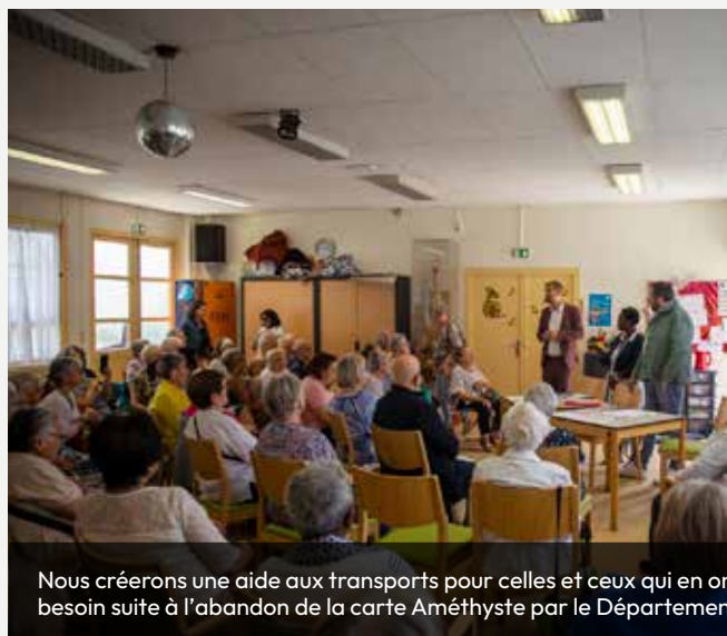
Nous créons une aide aux transports pour celles et ceux qui en ont besoin suite à l'abandon de la carte Améthyste par le Département