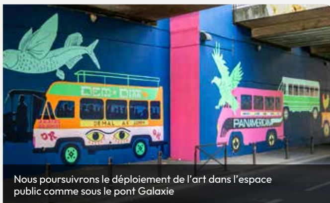
Nous poursuivrons le déploiement de l'art dans l'espace public comme sous le pont Galaxie