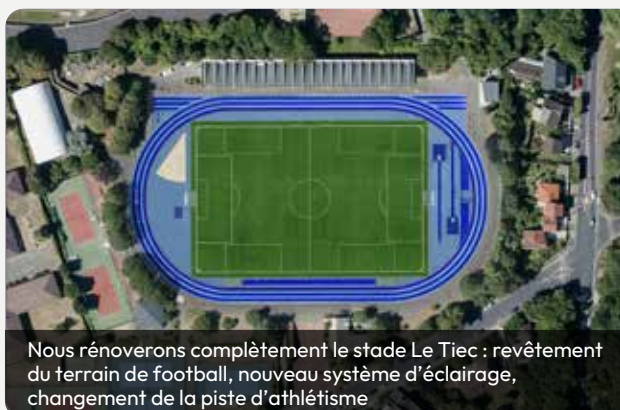
Nous rénoverons complètement le stade Le Tiec : revêtement du terrain de football, nouveau système d'éclairage, changement de la piste d'athlétisme