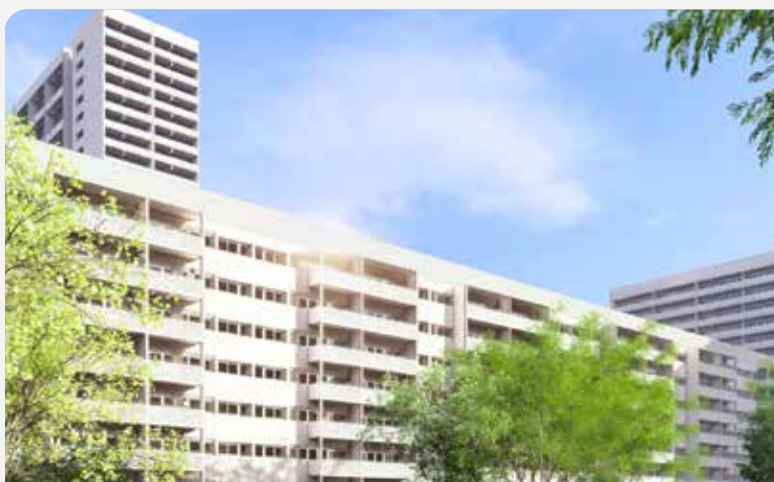
La réhabilitation du quartier de La Redoute permet d'améliorer les conditions de vie de ses habitantes tout en participant à la transition écologique