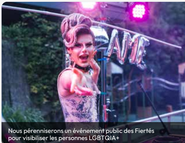
Nous pérenniserons un événement public des Fiertés pour visibiliser les personnes LGBTQIA+

120. Continuer de défendre et de promouvoir les droits de l'enfant en lien avec l'Unicef