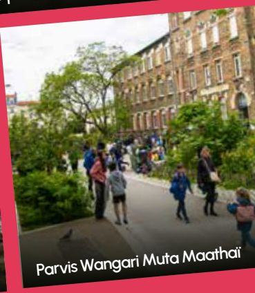
Parvis Wangari Muta Maathai